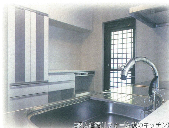
《個人住宅リフォーム後のキッチン》