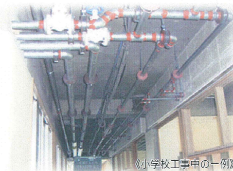
《小学校工事中の一例》