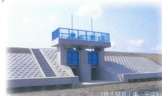
《排水樋管工事 完成》